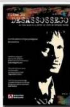
Filme do Desassossego 2010