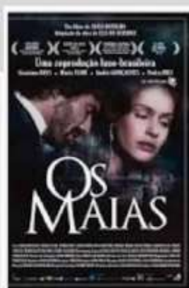
Os Maias 2014