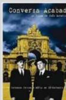
Conversa Acabada 1981