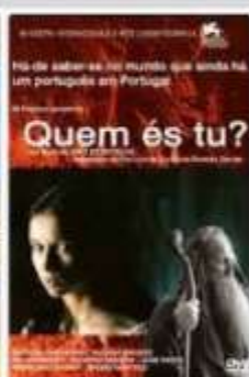
Quem És Tu? 2001